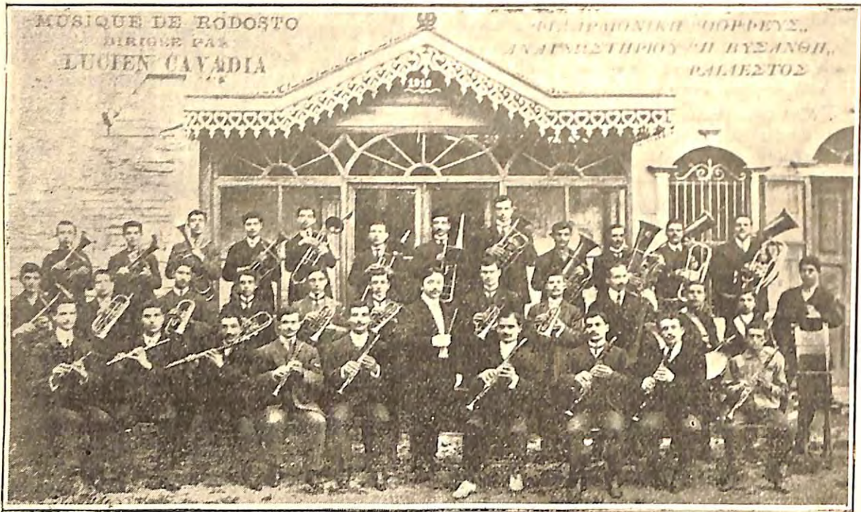
Η ΦΙΛΑΡΜΟΝΙΚΗ Ὁ ΟΡΦΕΥΣ, ΤΗΣ ΡΑΙΔΕΣΤΟΥ

Ἐν Ἑλλάδι. — Ἐγκαίρως εἶχομεν γράφει, ὅτι ἡ Διεύθυνσις τοῦ Ὁδείου Ἀθηνῶν εἶχε προκηρύξει πέρυσιν Ἀβερῶφειον μουσικὸν διαγωνισμὸν πρὸς μελοποίησιν 20 μαθητικῶν, φοιτητικῶν καὶ στρατιωτικῶν ᾠμάτων, πρὸς βράβεισιν ἐκάστου τῶν ὁποίων διέθετεν 125 δραχμ. Ἡ κρίσις θὰ ἐγίνετο κατὰ τοὺς ὅρους τοῦ διαγωνισμοῦ περὶ τὰ τέλη τοῦ λήξαντος ἔτους 1911, ἀλλ' αὕτη, δὲν γνωρίζομεν διατί, ἐγένετο μετὰ παρέλευσιν πέντε (ἀρ. 5)