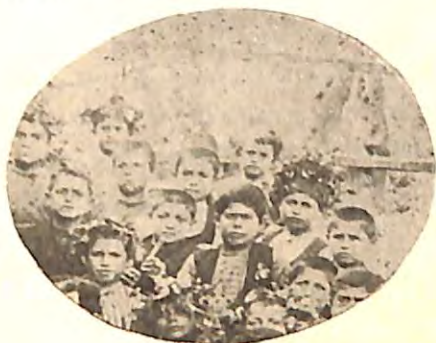
Ὁμιλος ἐστεφανωμένων ἀλητῶν παιδῶν ἐν Ὁρτάκισι.

συνορευούση τῇ Βιθυνίᾳ Φρυγία . τῇ κατ' ἐξοχὴν πατρίδι τῶν φρυγικῶν αὐλῶν τῆς ἀρχαιότητος. Αἱ πρὸς τιμὴν τῆς Κυβέλης ἑορταὶ ἐκαλοῦντο Μεγαλήσια , διότι ἐτελοῦντο πρὸς τιμὴν τῆς Μεγάλης Θεᾶς , οἱ ἱερεῖς δὲ Γάλλοι , ἐκ τοῦ Γάλλου ποταμοῦ τῆς Φρυγίας. Κατὰ τὴν αὐτὴν Μυθολογίαν ἡ πεύκη καὶ ἡ ἐλάτη ἦσαν τὰ εἰς τὴν Θεὴν ἀφιερωμένα ἱερὰ δένδρα, ἡ μὲν, διότι ἐκ τοῦ ξύλου τούτου οἱ ἱερεῖς αὐτῆς κατεσκευάζον τοὺς ἱεροὺς αὐλοὺς , ἡ δὲ πρὸς ἀνάμνησιν τοῦ Ἄτιος, ὃν αὐτὴ εἰς τὸ δένδρον τοῦτο μετεμόρφωσεν. Ὁ Ἄτιος, νέος καὶ ὠραίος τῆς Φρυγίας ποιμὴν, ἦτο ἱερεὺς τῆς Κυβέλης, ὃν ἡ Θεὰ αὐτὴ ἠγάπησεν ἐμμανῶς. Ἄλλ' οὗτος ἀντ' αὐτῆς προὔτιμησε τὴν νύμφην Σαγγαρίδαν , θυγατέρα τοῦ καὶ διὰ τῆς Βιθυνίας