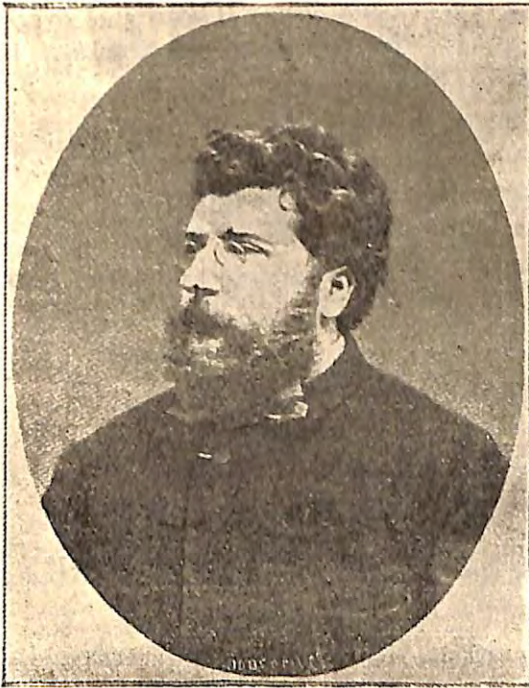
ΓΕΩΡΓΙΟΣ ΜΠΙΖΕ — GEORGES BIZET