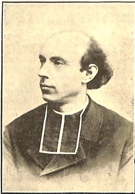
Ο ΓΑΛΛΟΣ ΑΚΑΔΗΜΕΙΑΚΟΣ Α. BOURDON

παμψηφει ἀντεπιστέλλον μέλος. Ἡ περισπούδαστος τεχνικὴ αὐτοῦ εἰσήγησις ἐδημοσιεύθη ἐν τῇ Περιδοκικῇ τῆς ἐν λόγῳ γεραρᾶς Ἀκαδημίας. Τὸ δημοσιευόμενον θερησκευτικῆς χροιάς μουσουργημα τοῦ κ. Bourdon, διακρινόμενον διὰ τὴν σοβαρότητα και μεγαλοπρέπειαν αὐτοῦ, ἔχει και συνέχειαν ἐν τελείῳ τετραφώνῳ χορῷ μετὰ συνοδείας τοῦ Ἐκκλησιαστικοῦ Ὁργάνου.