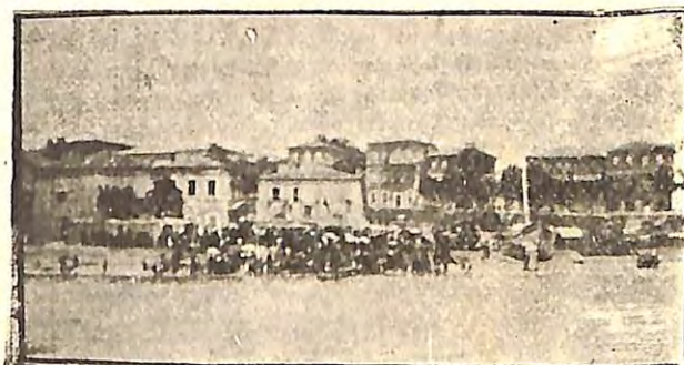
Η ΚΑΤΑ ΤΗΝ ΑΠΟΒΙΒΑΣΙΝ ΥΠΟΔΟΧΗ ΤΩΝ ΕΚΔΡΟΜΕΩΝ.

σε, προσεῖλκυσε και ἡμᾶς διὰ νὰ ἐπισκεφθῶμεν ἐκ τοῦ πλησίον τὰ Ἀρχιγένεια καθιδρύματα, ἐν οἷς και ἡ μουσικὴ, ἢ τε ἐκκλησιαστικὴ και ἡ λοιπὴ σχολικὴ, κατὰ ρητὴν τῶν ἀειμνήστων αὐτῶν εὐεργετῶν και ἰδρυτῶν ἐπιθυμίαν, διδάσκειται ἐν εὐρυτάτῳ βαθμῷ ὑποχρεωτικῶς. Ἄλλ' ἐκτὸς τῆς τετραῶρου και πενταῶρου ὑποχρεωτικῆς διδα-