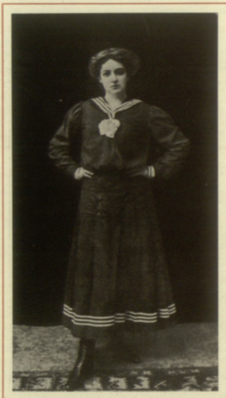
Η Κυβέλη στον ρόλο της Φωτεινής Σάντρη στο ομώνυμο έργο του Γρηγορίου Ξενοπούλου.

Η Κυβέλη αποσύρθηκε οριστικά από το θέατρο το 1965. Πέθανε το 1978.