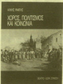
"Χορός, πολιτισμός και κοινωνία", του Αλκή Ράλη