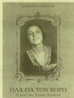
"Όλα για τον χορό. Η ζωή της Λόρας Στράτου", από την Κ. Αθανασίου