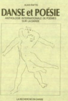
"Danse et poésie", Ανθολογία γαλλικής ποίησης για τον χορό στα γαλλικά, από τον Αλκή Ράλη