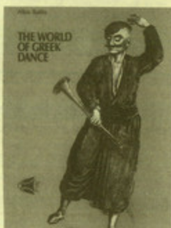
"The world of Greek dance" by Alkis Rallis