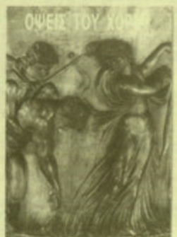
"Όψεις του χορού", κείμενα από 14 μελετητές