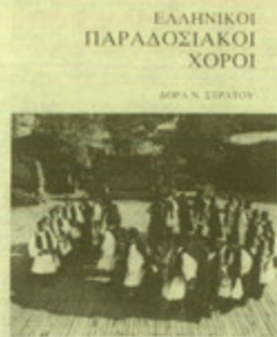
"Ελληνικοί παραδοσιακοί χοροί", της Λόρας Στράτου