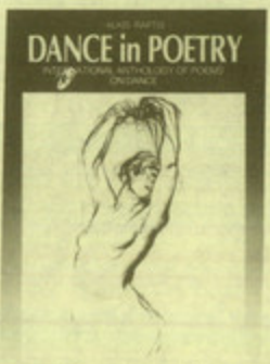
"Dance in poetry", Ανθολογία αγγλικής ποίησης για τον χορό στα αγγλικά, από τον Αλκή Ράλη