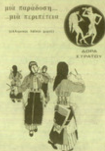
"Μια παράδοση μια κεραιότερα" Αυτοβιογραφία της Λόρας Στράτου