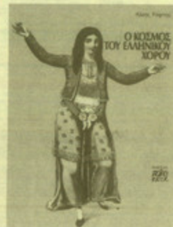
"Ο κόσμος του ελληνικού χορού", του Αλκή Ράλη