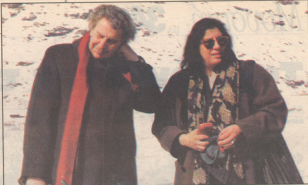
Μίκης Θεοδωράκης-Μαρία Θερεσενίση στο δανά της Νορβηγίας

Ο Μίκης Θεοδωράκης ταξίδεψε στις γωνίες παραθαλάσσιες στο φινιά, επι-