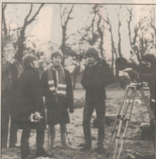
Αρχή του 1967 και οι Μπέντλεϊ φωτογραφίζονται σε γυμνάσιο για το «Strawberry fields forever»

« Η ταν το χρόνο της ορμητικότητας και της τόλης (...). Στο χρόνο του σπασμού, από το 1966 και πέρα, απελευθύνοντο από το στενό χέρι του σπουδαίου Τζορτζ Μάρβιν, οι Μπέντλεϊ παράγοντο τραγουδιά και θα έμεναν για πάντα φρέσκα και θα έβγαζαν τα κρύματα μέσα των οποίων δουλεύονταν οι νέοι». Το σπασμό του Μπρεκ Τέλερ στο φιλμάκι του Anthology 2 (Μπέντλεϊ, ΕΜΙ), διάδοχος της δεύτερης συλλογής με ανάδοτες ποιές ηχογραφήσεις των «Καθαρών», ξεκινάει από στενό συνείδηση για να ξεκαρτίσει. Ομως, όταν θέλεις να πρωτο από το δαδ στο μπάνιο, θα ακολουθήσει η συναισθηματική έδραση του βρετανικού υπερόπλου Τζορτζ του συγκροτήματος. Εντάξει, θα σφαιρίσει το άλμπουμ αρχίζοντας με το «Real love» , ακόμη ένα τραγουδι βασισμένο σε πρότυπα ηχογράφηση που έκανε ο Τζον Λέοντ το 1979. Είναι το αγαπητό από το «Free as a bird» , όμως παραμένει ένα τραγουδι «πυρκαχιά» κι αυτό δεν 'ν' αλλάζει ούτε τη μηχανή που ήταν ο Τζορτζ Μάρβιν , που είχε κάνει και το «Surrender» Barrett Lewelly «Rings Club Band» , ούτε ότι ο Ρίτμικ Στρίπ χρησιμοποιεί, «χάρη