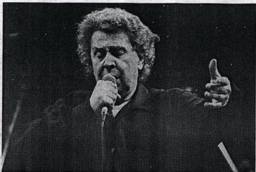
Mikis Theodorakis, Komponist, Politiker, Klassiker