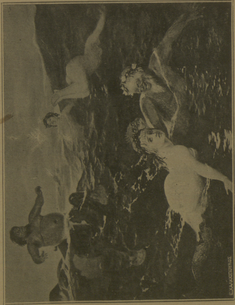
ΠΑΙΧΝΙΔΙ ΤΩΝ ΚΥΜΑΤΩΝ