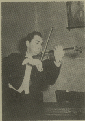
Ο ΣΟΛΙΣΤ ΒΥΡΩΝ ΚΟΛΑΣΗΣ