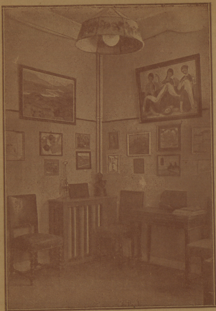
ΜΙΑ ΓΩΝΙΑ ΤΩΝ ΓΡΑΦΕΙΩΝ ΤΗΣ "ΒΡΑΔΥΝΗΣ", ΟΠΟΥ Η ΣΥΛΛΟΓΗ ΕΡΓΩΝ ΝΕΩΤΕΡΩΝ ΕΛΛΗΝΩΝ ΖΩΓΡΑΦΩΝ