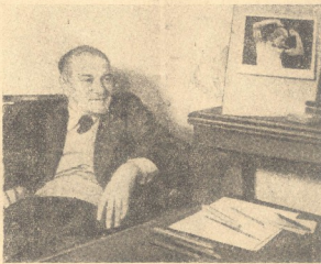
'Ο άρρωστος Νιζίνσκου έχοντας από βάθος μία φωτογραφία του, άνάμνησιν από τούς παλιούς του θριψμούς

Καί έπειτα: 'Επειτα έρχεται γιά τον νέον αὐτόν των 28 χρόνων που πρό όλγων άκόμη έτών έθωρεϊτο ό «νεοσοῦμενος τών θεών» μία νύχτα άτελεύτητη, μία νύχτα που τον τυλίγει με τό σκοτάδι της 33 δολόκληρα χρόνια. Δέν ε'ινε παρά ένας ίσκιος—άλλά πόσο αγαπητός πάντα—στη ζοή μιᾶς γυναίκας κ' ενός παιδιού. 'Η κατάστασις του παρουσιάζει κάθε τόσο μία άλλωγή. Ε'ινε φορές, που μιλοῦν γιά καλυτέρευσι, κ' άλλες, που γίνεται λόγος γιά τέλεια ίαση. 'Ός τόσο τίποτα άπ'αὐτά δέν πραγματοποιείται. 'Ο Νιζίνσκου όλον αὐτόν τον καιρό σκέπτεται σιιπηλός, ζωγραφίζει κατ' ά τρόπο που δείχνει πόσο ζωντανό μένει ακόμα μέσα του τό αίσθημα τής φόρμας και γράφει τό ήμερολόγιό του γιά τον Ντιαγκήλεφ: «Ε'ινε φοβερός! 'Αν και μικρός στό άνάστημα, μοιάζει δετός, ένα πουλί άρπακτικό, που πρέπει να μη τό άφίνουν να πληρώσῃ στό μικρά πουλάκι! Φαντάζεται πώς ε'ινε ό θεός τής Τέχνης, θά τον προκαλέσῃ όμως σ' έναν άγώνα! 'Ο κόσμος όλος