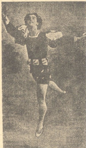
Ό Νιζίνσκυ στη «Σχεραλάτ» του Ρίμσκυ - Κόρακοφ

Από τή βραδιά αυτή άρχισε γιά τόν Νιζίνσκυ μιά κυριολεκτικά λιγυιάδης σταδιοδρομία, ένα άπίστευτο έξαικολογητικό άνέβασμα: Προσλαμβάνεται άμέσως στό θέατρο Μαρίνου τής Πετρούπολεως, όπου κατα-λαμβάνει από τής πρώτης στιγμής, τήν θέση του κορυφαίου χορευτού. Έκει τόν έβλε ό περίημος τότε Ντιαγκήλεφ, πού και στό Παρίσι άκόμη έθιλωετο μιά από τίς όψηλότερες, τίς πού άπρόσιτες κορυφές τής μεγάλης Τέχνης. Ποιάς θά μπορούσε νά κατανοήση περισσότερο άπ' αυτόν, τό δαιμόνιον αυτό τής εύλωγτης κινήσεως; Ποιάς θά μπορούσε όσο αυτός νά θαυμά-σι στην άξία τους τήν άρμονία τής κινήσεως αυτής και τήν έκφροστική τής δύναμι; Και τότε συνήθη έκείνου, πού ήταν έσόμενον νά συμψη. Ό Ντιαγκήλεφ, πού τ' δ-νομά.του μόνο ήλεκτρίζει έξωγράφους σαν τόν Πिकासό, τόν Ματίς, τόν Μπρακ, τόν Μιρώ, τόν Ουτρέλιου, τόν Ντεραϊν και μουσικούς σαν τόν Ντεμυσού, τόν Σαγκιέ, τόν Στραβίνσκυ, τόν Προκόφιεφ, τόν Μιλώ, τόν Χόν-νεγκερ, τόν Πουλένκ, προσπάθησε νά κερδίση γιά τό