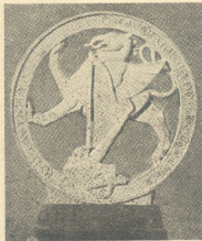
ΤΟ ΤΡΟΠΑΙΟ ΤΙΜΗΣ ΤΟΥ ΦΕΣΤΙΒΑΛ Πάνω ο' αυτό αναγράφεται το μυσό: «Ευλογημένος είναι ο κόσμος που τραγουδά».

Ακολούθησε, κατόπι, διαγωνισμός χορωδιών νέων ηλικίας 15 ως 21 χρονών. Τον τελευταίο καιρό, παρατηρείται ο' όλη τη Δ. Ερώρητη μία σημαντική προσπάθεια για τη μουσική μόρφωση των νέων, κυρίως άμισθος μετά την άφοροτή τους από τις διάφορες σχολές Μέσης Παιδείας, και ο διαγωνισμός αυτός είναι άρκετα ένδεικτικός. Μιά από τις χορωδίες, που έλαβαν μέρος, ήρθε από τη Λουιζιάνα των Ήνωμένων Πολιτειών, κάνοντας άεστορικώς πέντε χιλιάδες μίλια. Το πρώτο βραβείο πήρε η Σκωτική χορωδία νέων «Ορφείας», που τραγούδησε με ελάνθαστη σιγουριά, ακρίβεια και μουσική κατανόηση. Το δεύτερο πήρε Άγγλική, και το τρίτο Ουαλλική χορωδία.