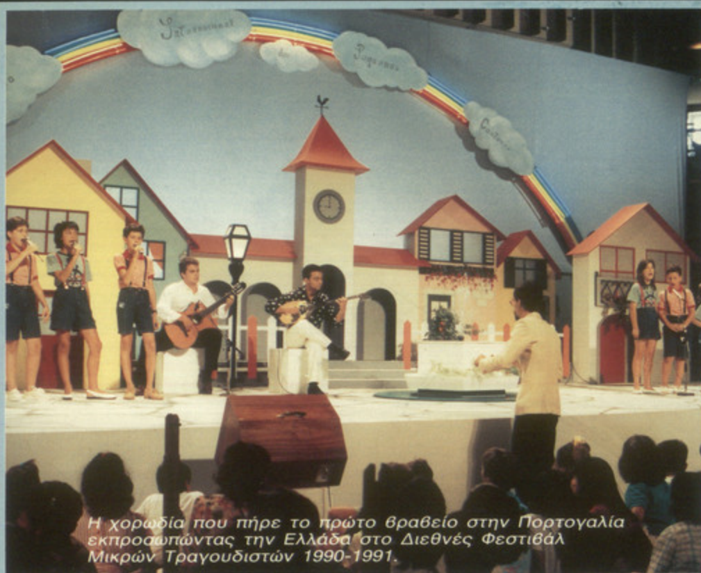
Η χορωδία που πήρε το πρώτο βραβείο στην Πορτογαλία εκπροσωπώντας την Ελλάδα στο Διεθνές Φεστιβάλ Μικρών Τραγουδιστών 1990-1991.