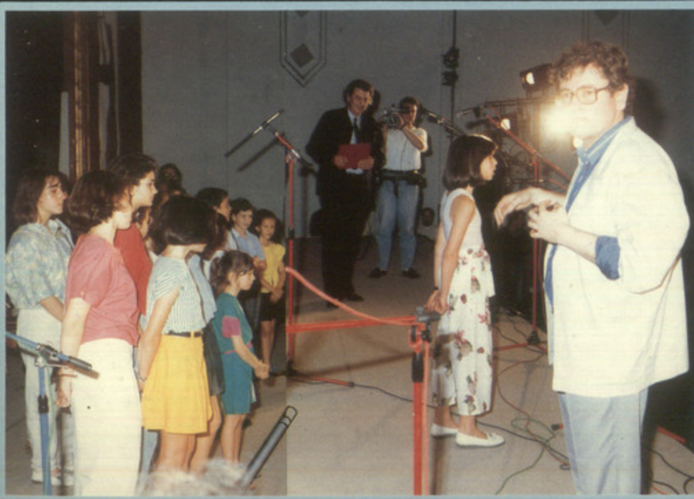
Καιρός λοιπόν για περιπέτειες των παιδικών ήχων μέσα στον αθώο αγνό χώρο υπάρχει ακόμα ελπίδα.