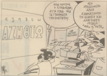
Τον Γιάννη Καλαϊτή από την "Ελευθεροτυπία"