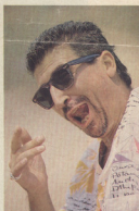
Κλήροσε και το πρώτο λαχείο, μεγάλη

κοιτάτε πονηρά όταν φέρνει το πόδι της πάνω στο δικό σας και με το καλό φεύγετε για το ξενο- δοχείο της ή κανένα εφημεκό μέ- ρος που ήδη γνωρίζετε. Μην πα- ρασυρθείτε σε υπερβολικές γλύ- κες και μη φύγετε για το σπίτι πριν πάρετε δανεικά για το ταξί.