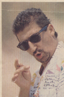
Καρ πο μη, καρ...

τη διαδρομή. Όταν το ταξί φτά- σει στον προορισμό του δώξατε επιδεικτικά το πεντοχίλιορο που έχετε γι' αυτές ειδικά τις περιπτώσεις. Δέκα φορές στις δέκα ο ταξίτζής δεν θα το πάρει. Θα πληρώσει πάλι εκείνη, αλλά ευγνωμονώντας την ελληνική φιλίαξενία. Μάλλον τότε θα σας χαϊδέει τα μαλλιά, γι' αυτό, μόλις καθήσετε, προσφέρετέ της μια χαρτοπετσέτα για να σκου- πίσει τα χέρια της. Παραγγέλι- νε ό,τι σας αρέσει, την αφήνετε να σας ταισίε ντολμαδάκια, που μετά από μια ώρα δεν θα χει μάθει ακόμα να τα προσφέρει σωστά, την ποτίζετε κρασί μέχρι που να θαλώσει το μάτι της, την