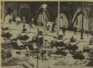
Ήρσαν οι Αμερικανοί Γερμανοί πολεμιστές κατά πόλεμο της Γερμανίας, οι Βοσνιανοί κατά πόλεμο μεταξύ Αυστριακών και Σέρβων, οι Ιάπωνες κατά πόλεμο της Κίνας κ.λπ.