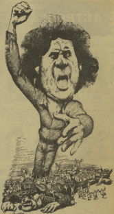
Θ Theodorakis τραγουδάει, β. Κολυβάκης τραγουδάει.

Περί Τέχνης ΑΓΓΕΛΟΣ ΠΑΝΟΣ Η τέχνη είναι η ζωή. Η πολιτική είναι η ζωή. Η τέχνη είναι η ζωή. Η πολιτική είναι η ζωή. Η τέχνη είναι η ζωή. Η πολιτική είναι η ζωή. Η τέχνη είναι η ζωή. Η πολιτική είναι η ζωή.