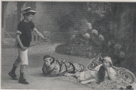
LE PAPILLON, LE CHASSEUR ET LA CHENILLE (Voir programme N° 7)

en faveur de l'œuvre de l'Hôpital d'Enfants