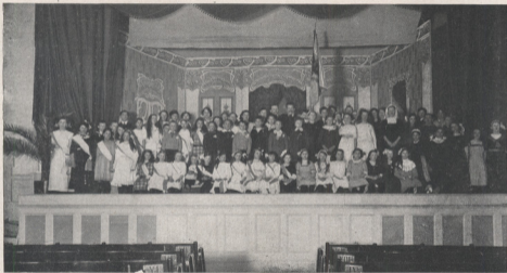
L'ÉCOLE POPULAIRE DE MUSIQUE ET SON DIRECTEUR