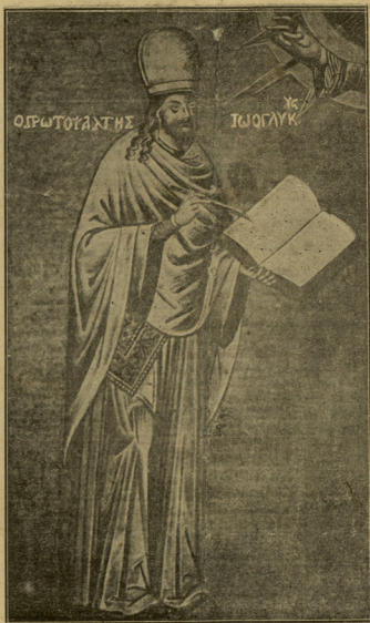
ΙΩΑΝΝΗΣ Ο ΓΑΥΚΥΣ