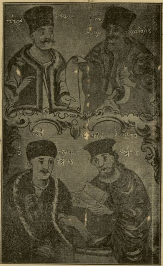
ΙΩΑΝΝΗΣ Ο ΤΡΑΠΕΖΟΥΝΤΙΟΣ